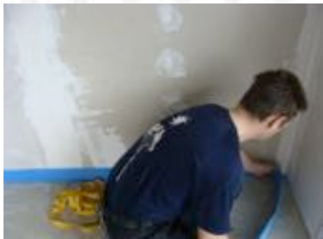
La bande de rive est posée sur tout le pourtour de la pièce.