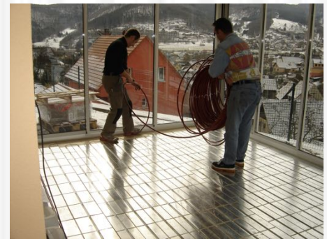
Le tuyau est mis en place dans les rainures prévues à cet effet.