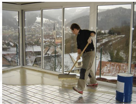
La résine faisant office de chape est coulé sur l'ensemble de la surface.