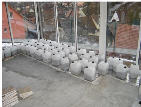
Les éléments têtes ainsi que les plaques de chauffage sont collées au sol et contre la bande de rive.