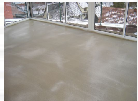
Pour la pose d'un carrelage, la résine est sablée afin d'adhérer au mieux au carrelage.